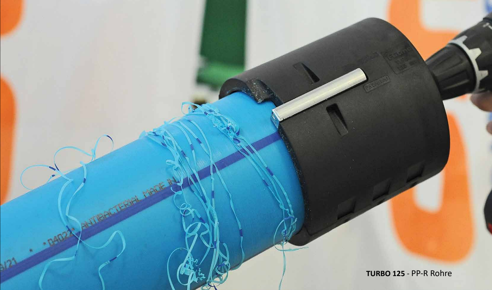
TURBO 125 - PP-R Rohre