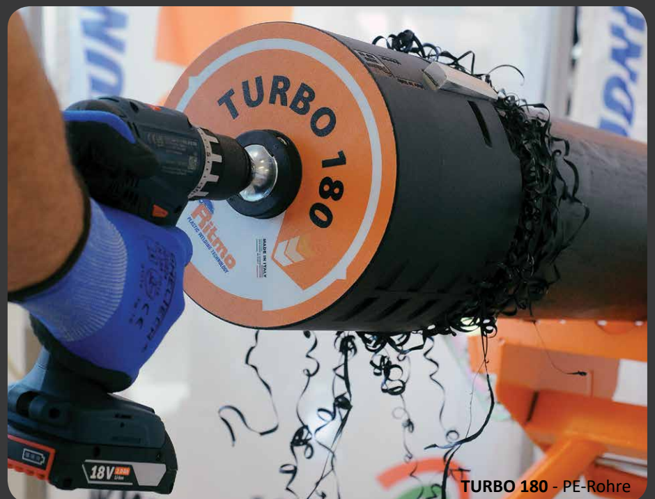
TURBO 180 - PE-Rohre

PE und PP Rohr \varnothing 125 mm Schällänge 100 mm Zeit: ca 20"