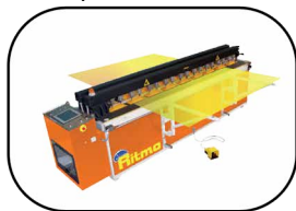
Tipo de soldadura